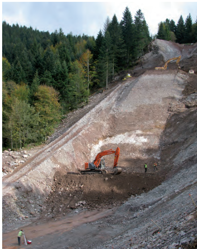
Travaux du «Plan Tremplins Vosges» Gérardmer - Automne 2009 - K65m